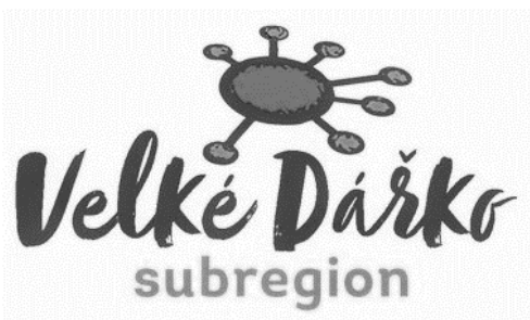
nové logo DSO

Další aktivity se týkají ostatních projektů DSO, jako je například projekt Cyklostezky v regionu Velké Dářko, pořízení kompostérů pro občany Subregionu Velké Dářko, nová koncepce odpadové hospodářství subregionu apod. Nyní finišuje projekt Propagace území Subregionu Velké Dářko ve vazbě na cestovní ruch, kdy výstupem projektu jsou nové informační letáky o subregionu včetně informačních letáků o některých obcích DSO, turistické letní i zimní mapy, turistická razítka, vizitky a pohlednice. V rámci projektu propagace bylo také navrženo nové logo Subregionu Velké Dářko, které vychází z unikátní masožravé rostliny „ rosnatky okrouhlolisté “, která se také nachází na rašeliništích u Velkého Dářka.